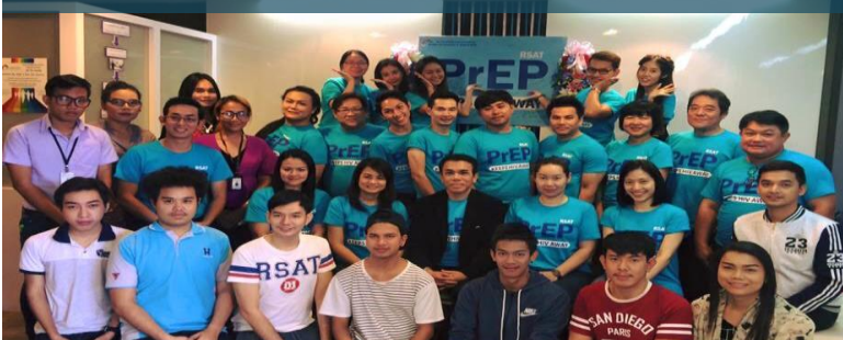
RSAT BKK (26 Nov. 2015)

Enrollment: 98 Agreed to take PrEP: 59 (60%)