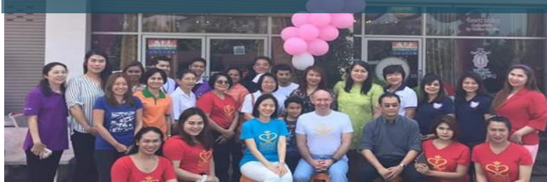
SISTERS PTY (22 Oct. 2015)

Enrollment: 126 Agreed to take PrEP: 62 (49%)