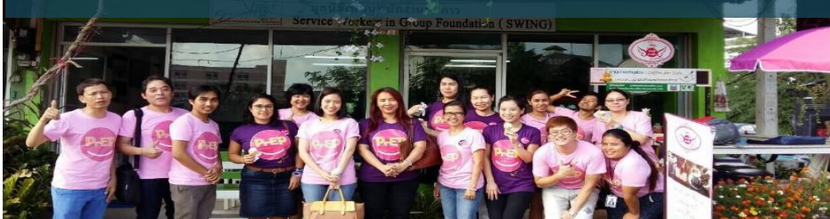
SWING PTY (24 Nov. 2015)

Enrollment: 33 Agreed to take PrEP: 23 (70%)