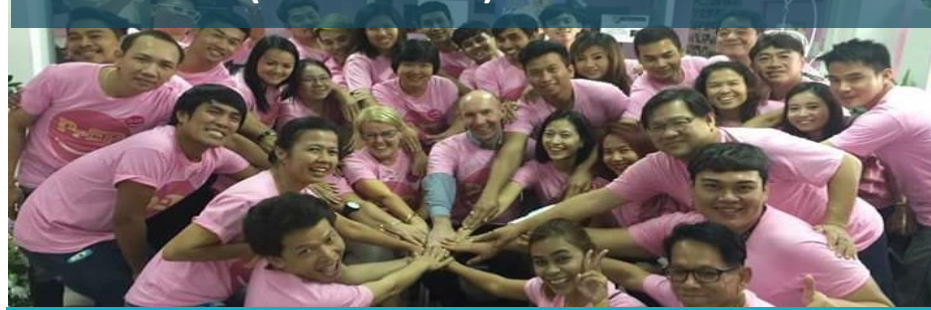
SWING BKK (29 Oct. 2015)

Enrollment: 45 Agreed to take PrEP: 20 (44%)